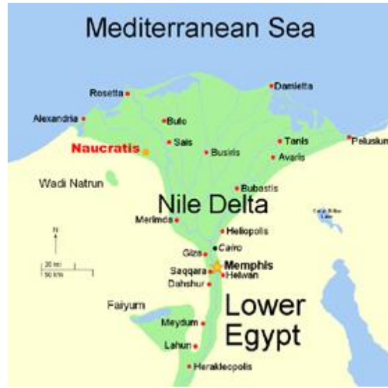
Harita 6. Nil deltası ve belli başlı merkezler

İon kentlerinin Doğu Akdeniz'de faaliyet göstermeleri ve Karadeniz'den Mısır'a uzanan bölgelerde koloni kurabilmeleri Lydia hegemonyası altında ezilmediklerinin göstergesi olmalıdır. M.Ö. 7. yüzyılın ortalarında İonialılar Mısır'da Naukratis adında bir koloni kurdular. Aslında koloniden çok bir emporium yani ticaret merkeziydi. Helenlerin denizaşırı yerlerde kurdukları koloniler onlar için yeni bir yurt oluyor ve bağımsız polis idealini onda da yaşıyorlardı. Ancak Naukratis, bizzat firavunun izniyle kurulan ve görece olarak onun denetiminde olan bir ticaret üssü olmaktan öteye gidemedi. Bununla birlikte Helenler bu üs aracılığıyla doğu uygarlıklarıyla çok daha iç içe hale geldiler (Emporium'un yeri için bkz. Harita 6).