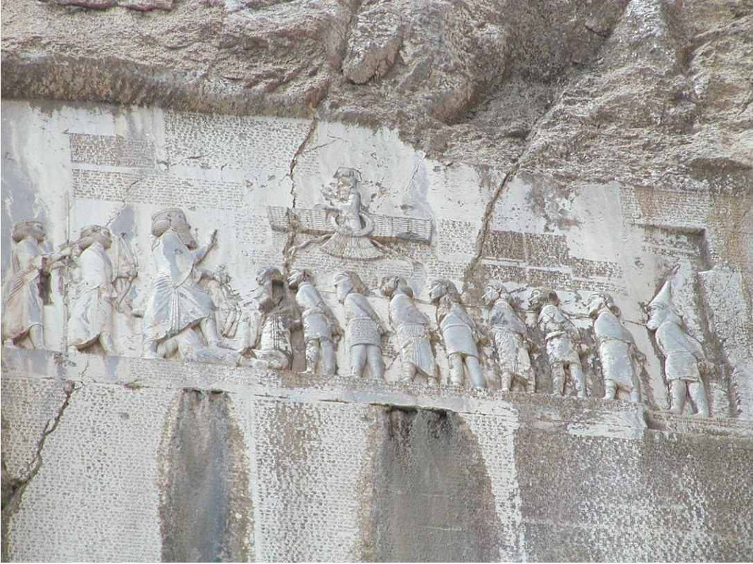
Behistun Yazıtı, I. Darius hükümdarlığı sırasında sırasıyla Hemedan ve Babil kentleri (Medya ve Babilya'nın başkentleri) arasındaki bir yol boyunca oyulmuştur. Yazıt, Pers krallarının tarihini üç dilde kaydetmiştir: Elam dili, Babil dili, ve Eski Farsça.

Persepolis'in inşası, Ahamenişliler'in sadece sanat ve ihtişam açısından değil, aynı zamanda konumu nedeniyle de büyüyen gücünü temsil ediyordu. Darius, erişimi zor olduğu için Persepolis bölgesini özellikle seçti. Ahameniş'in erişimi kolay ve ekonomik potansiyeli büyük olan birçok başkenti zaten vardı. Persepolis'in kurulması yalnızca Darius'un kazandığı zenginlik ve güç nedeniyle mümkün oldu. Darius bu şehri kurarken, tam da bu yönler dikkat çekmek istemiş olabilir.