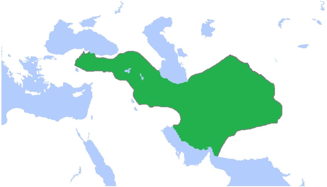
Med İmparatorluğu'nun olası sınırları.

M.Ö. 559'da, Kiros adında bir adam Pers İmparatorluğu'nun başına geçti. Kiros, Pers kralı Ahameniş'in büyük büyük torunuydu. Tarihçilerin Ahameniş Pers İmparatorluğu demesinin sebebi budur.